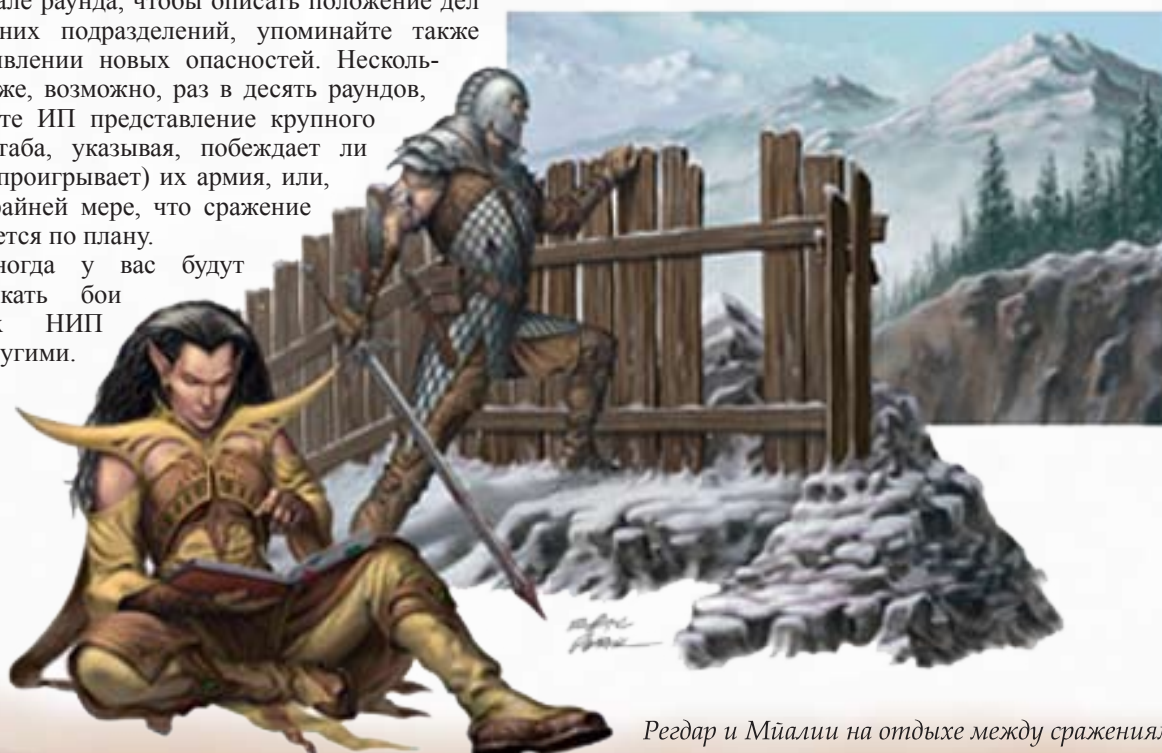
Регдар и Мйалии на отдыхе между сражениями

При планировании столкновений помните, что после четырех столкновений за день заклинатели, скорее всего, истратят все заклинания, варвары не смогут использовать свою ярость, а паладины все попытки изгнания. Продолжение может быть вы-