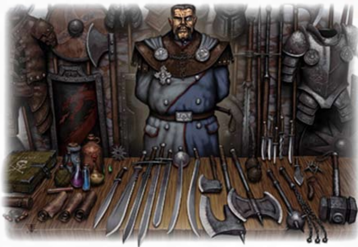
Хорошо-оснащенная армия предлагает своим солдатам самый широкий выбор снаряжения

Один из вариантов улучшения их перспектив накопления сокровищ заключается в том, чтобы отправлять их на задания, дающие шанс сразиться с более сильными существами, имеющими неплохое имущество и ценности. Вы бы даже могли оправить ИП в подземелье или вражескую цитадель в поисках мощного артефакта или припасов, чтобы использовать их против врага. Там они легко могли бы найти припрятанные сокровища, предметы или магические вещи.